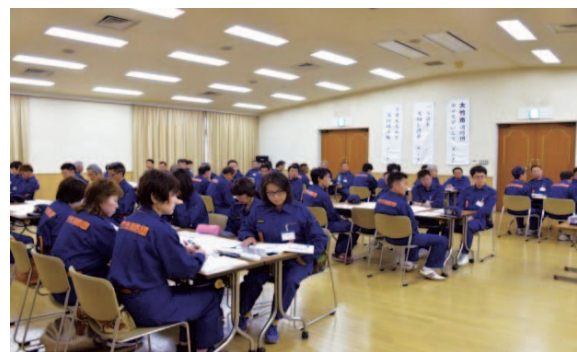
消防本部多目的ホールにて

各分団の班長以上を中心に参加した60名を10グループに編成し、4名の講師のご指導の下、DVDの上映を交えた講義や指差し呼称、指差し唱和で確認行動、タッチ&コール及び健康KYの実技による確認作業や各メンバーの健康状況を把握することの重要性を学びました。