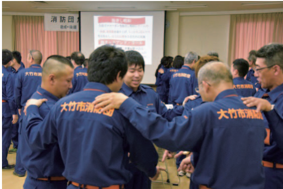
タッチ & コール

実技4の危険予知訓練では、イラストシートNO.7「林野火災での放水活動」の現場活動に潜む危険要因をチームで出し合い、各班共に積極的な意見によりシートが埋め尽くされ、有意義な研修となりました。