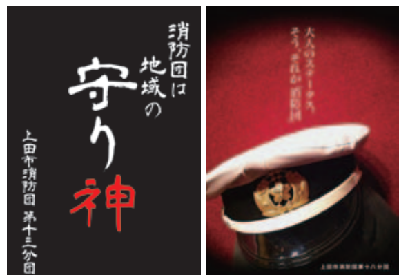
ポスター (左が13分団作成、右が18分団作成)